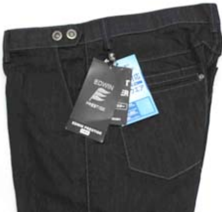
(EP512-00デニムライク ブルー)